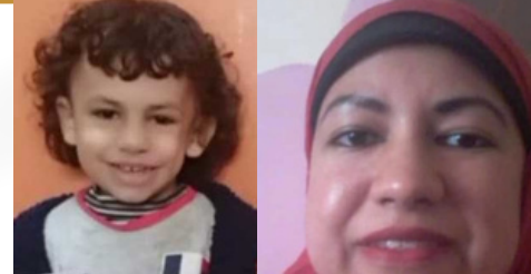
صورة للضحية وطفلها

وكشفت تحريات مباحث المطرية عن أن المتهم هو قاتل المجنى عليهما زوجته وابنه، بسبب خلافات بينه وبين المجنى عليها منذ سنوات بسبب عدم عمله، حتى ضاقت من ضنكه عليها ومكثت طرف والدها، إذ تعدى عليها بالضرب مرات عديدة، فحررت قبته محاضر قضائية وتنازلت عنها عقب ذلك.